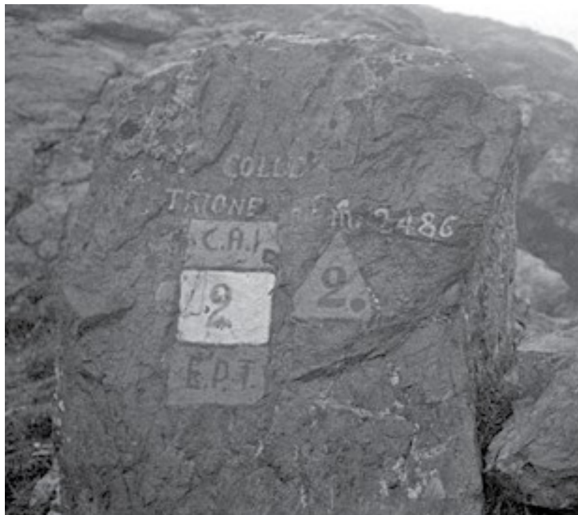
Segnavia alpini al colle del Trione