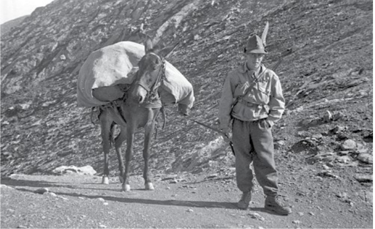
Salita verso Roccabianca, in val Germanasca