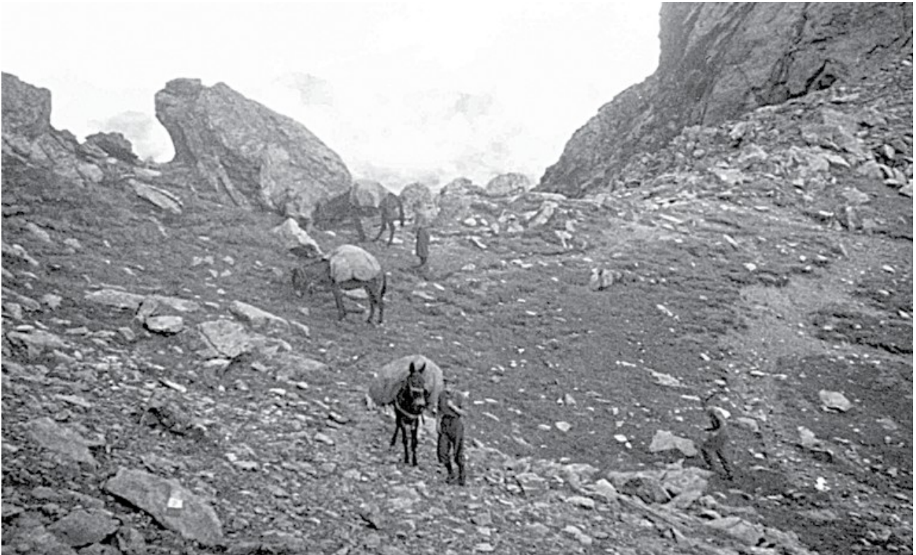
Il passaggio del colle della Crocetta, tra val Grande di Lanzo e valle dell'Orco