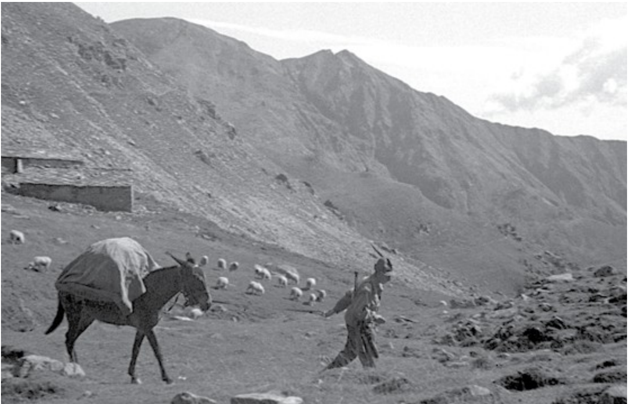
15 settembre 1943. Attraversando le valli di Lanzo