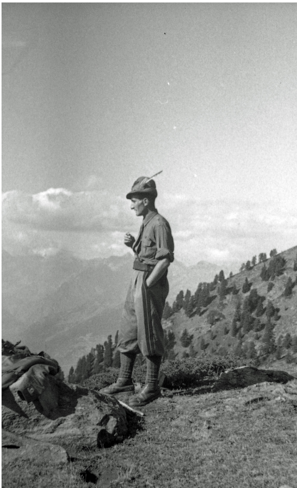
Pila, 5 settembre 1943

Per gentile concessione della famiglia, pubblichiamo le fotografie scattate da Ettore Serafino prima e nel corso del cammino da Aosta a Bobbio Pellice