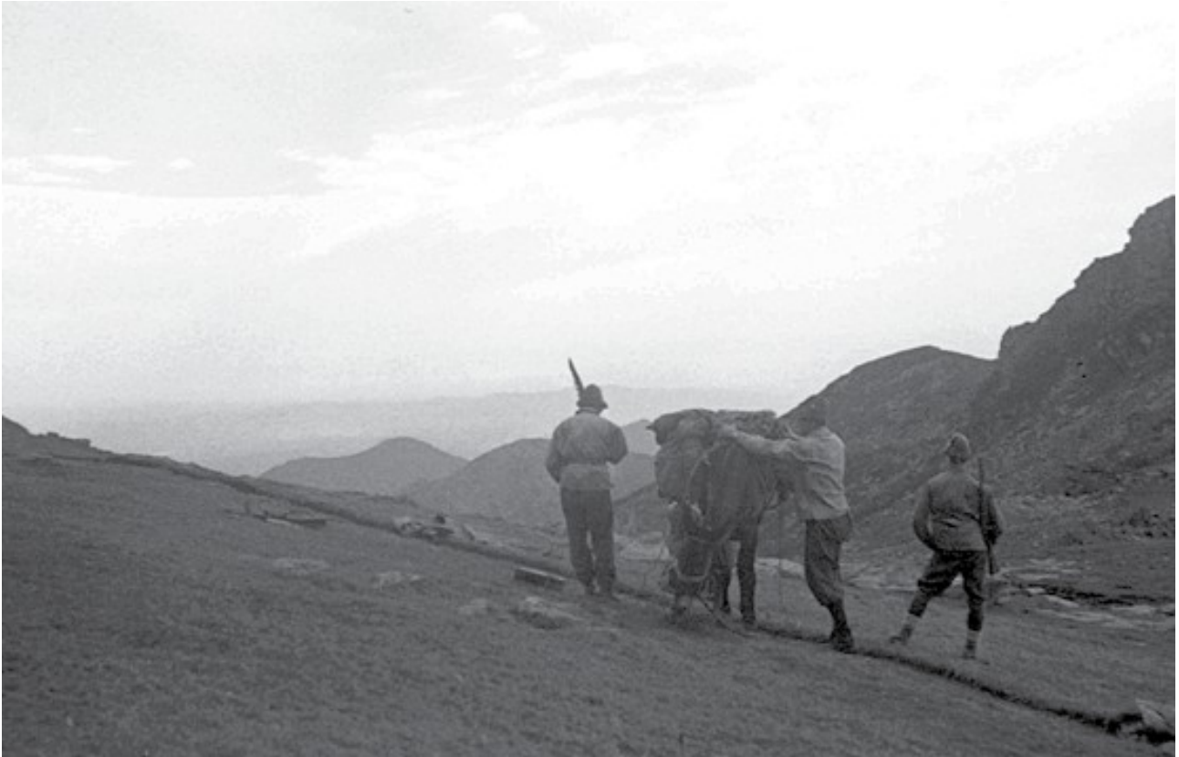
15 settembre 1943. Attraversando le valli di Lanzo