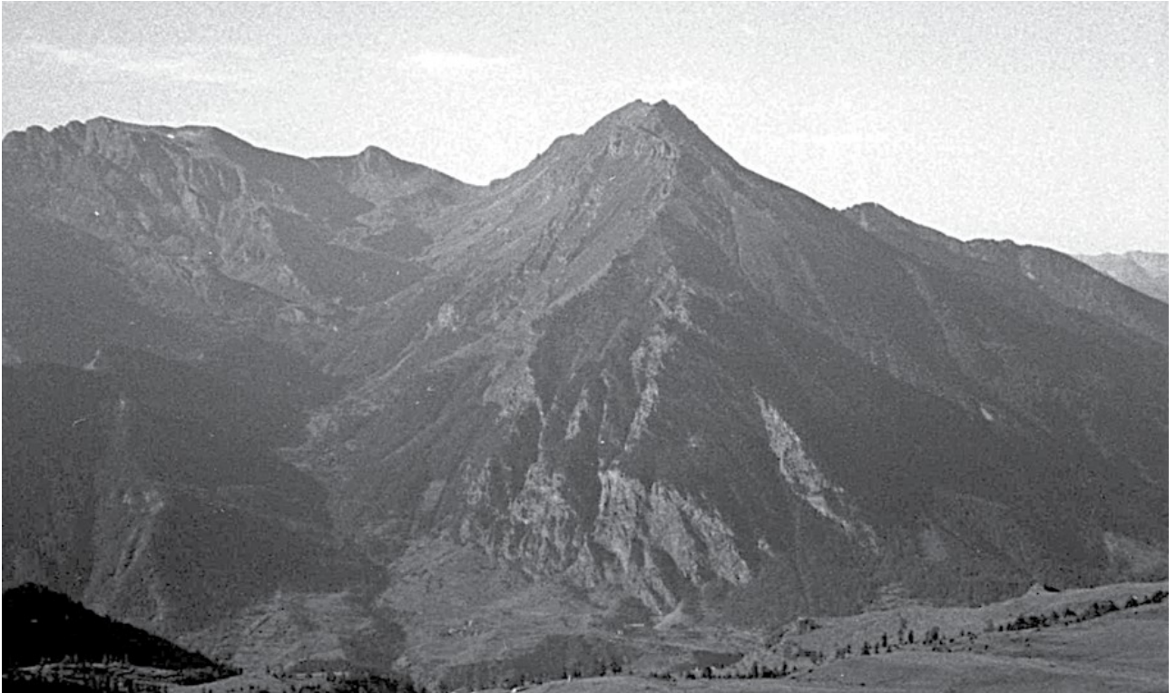
Il vallone dell'Albergian, in val Chisone